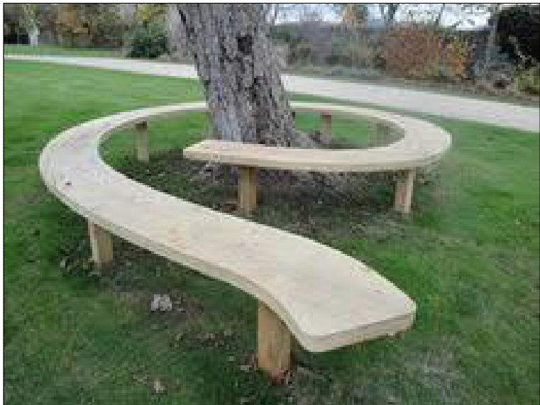
SO.503 Lavička do vyhlídky, tvrdé dřevo