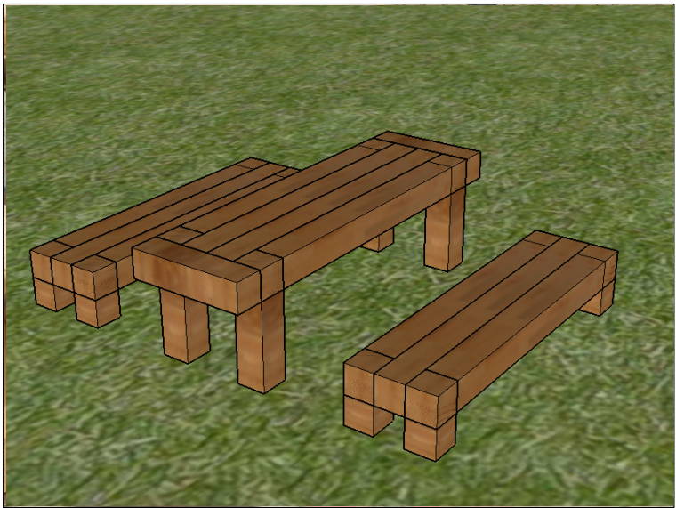
SO.507 Venkovní masivní stůl s lavicemi v délce 2 m, ukotvený proti manipulaci