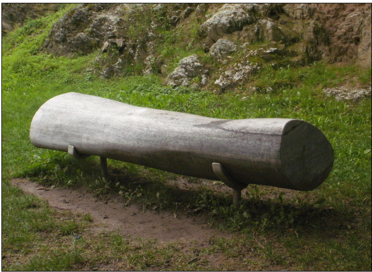
SO.502 Lavička z kmenového masivu, šířka 1,8 m průměr 40 cm, kovové partie s nerezovou úpravou