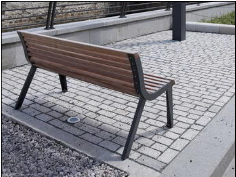
SO.501 Lavička k parkovým cestám