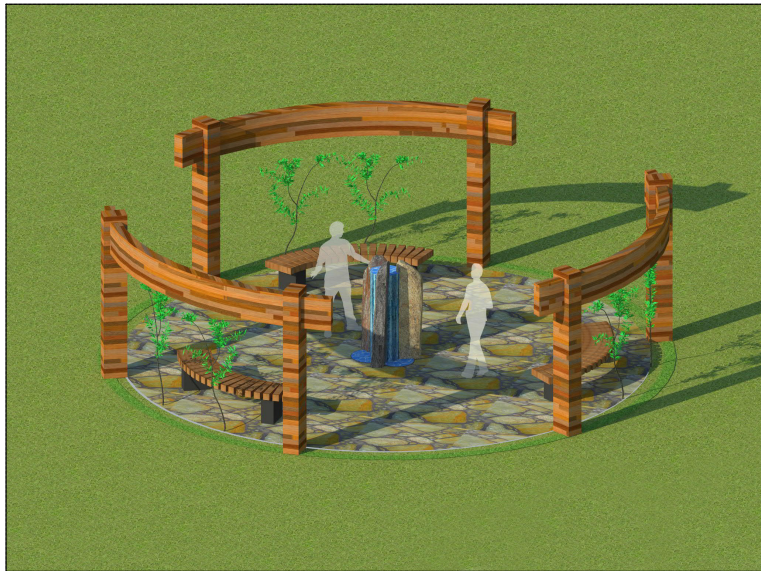
SO.504 Lavičky ke kašně, materiál odpovídá charakteru dřevěné pergoly, listy lavice mohou být buď v radiálním případně tangenciálním směru (sedák uzpůsoben pohodlnému posezu)