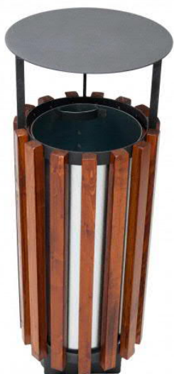
SO.505 Odpadkový koš oválný, odolná konstrukce, materiál a zpracování sladěné s lavičkou k parkovým cestám