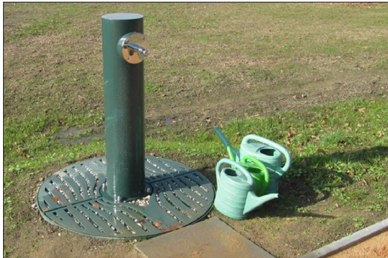
SO.508 Kohout na užitkovou vodu