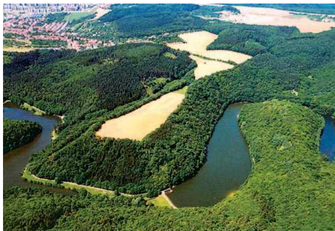
Letecký pohled na Staré Zámky.

Tolik říká pověst o Starých Zámkách, jak ji zaznamenal MUDr. František Elpl ve své knize z roku 1904 o pohádkách a pověstech z Líšně u Brna. Podobně jako v jiných případech, pověst zřejmě odráží v přijatelné formě pro venkovského člověka nějaký dávný nález pravěkých bronzových předmětů nebo mincí. Každopádně Staré Zámky už vydaly obrovské množství „pokladů“, které byly získány buď během archeologických výzkumů nebo při povrchových sběrech amatérů. Tento skalní ostroh, jehož svahy příkře spadají na SV a V do údolí Říčky a na JZ je rovněž chráněn hlubokým údolím, totiž během pravěku představoval přírodní pevnost, jejíž účinnost byla ještě zvýšena vybudováním mohutných ochranných valů. Přístup byl vlastně možný jen přes úzkou šíji na severozápadě, která se po opevnění dala dobře hájit. Plocha takto v raném středověku vybudovaného hradiště i s předhradími je odhadována na 13 hektarů s délkou 900 m ve směru SZ – JV.