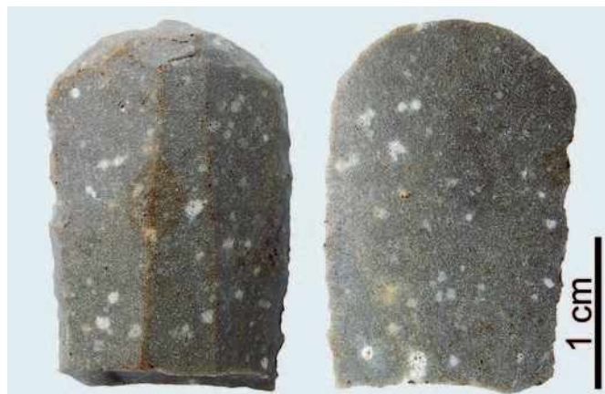
Škrabadlo z kropenatého středopolského rohovce, pozdní doba kamenná.