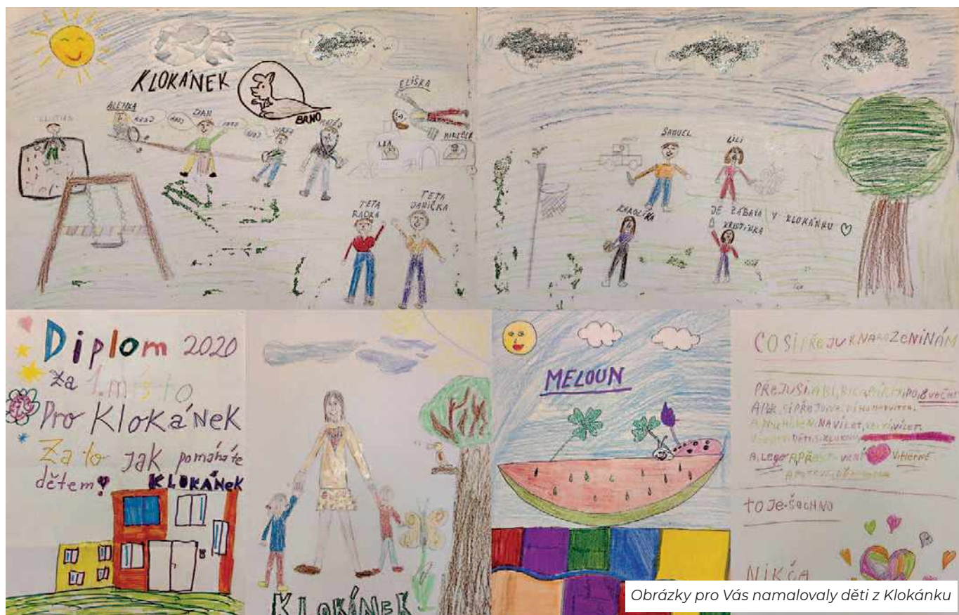
Obrázky pro Vás namalovaly děti z Klokánku

Teto, vám tady svítí světlo? Teto, vám tady teče teplá voda? Děti chodí do lednice a kontrolují, že tam to jídlo stále je. Toto jsou situace, které už tety v Klokánku nevyvedou z míry.