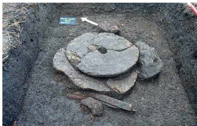
Sklad železných předmětů ukrytý pod dvěma žernovy. Výzkum M. Přichystal z ÚAPP Brno v r. 2018