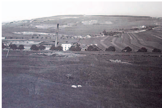
Pohled přes cihelny u Malé Klajdovky a Růženina dvora na jižní svah Hádů se začínajícími lomy (zleva doprava): V džungli, Klajdovský a Růženin. První třetina 20. století.

Území Líšně leží na jižním okraji Moravského krasu a díky tomu poskytovalo kvalitní vápenec jako surovinu pro pálené vápno i jako stavební kámen. Vápence devonského až časně karbonického stáří budují rozsáhlou severní část katastru a vyznačují se tvorbou několik decimetrů silných vrstev, takže se z nich dobře vylamují kvádříky. V druhé polovině 20. století se dobývaly a dodnes stále dobývají v obrovských lomech mezi silnicemi z Líšně a od Velké Klajdovky na Ochoz (Lesní lom, lom Kalcit) nebo hned za hranicemi katastru na Hádech. Tam se původní tři dílčí lomy – „Klajdovský neboli Městský, Růženin a V džungli“ postupně propojily v jeden obrovský velkolom. Čtvrtý lom s názvem „V Habeši“, jenž ležel na líšeňské straně, dnes už neexistuje. Byl při stavbě líšeňského sídliště postupně zavezen rozbitými panely a dalším stavebním odpadem. Dnes na něm stojí vilová čtvrť s odpovídajícím názvem „Nad lomem“.