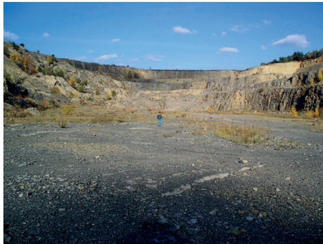
Největší jízvu po těžbě vápence na katastru Líšně představuje Lesní lom. Stav v roce 2008.

Vápno na bílení světnic i chlívů bylo velmi ceněným produktem, který formani rozváželi daleko na jižní Moravu. Do okolních vesnic