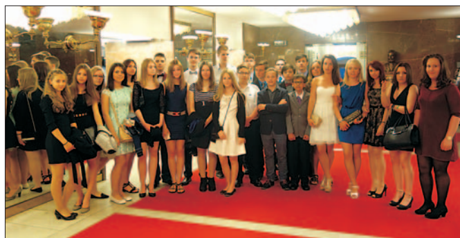
Výlet do Prahy si žáci osmých a devátých tříd ZŠ Masarova užili také díky návštěvě Národního divadla.