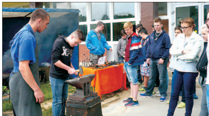
Žáci ZŠ Masarova zjistili, co obnáší práce uměleckého kováře.