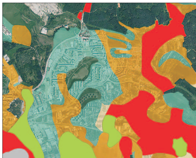
Půdy chráněných bonit (červené a oranžové vymezení) v MČ Brno-Líšeň