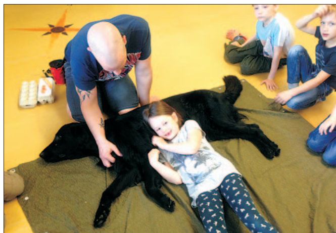
Při ukázce Canisoterapie na ZŠ Novolíšeňská si odvážnější děti mohly lehnout na Flat coated retrívra jménem Audi.