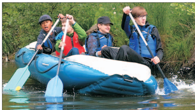
Konec roku přinesl žákům ZŠ Horníkova zážitek v podobě sjíždění řeky Svratky.