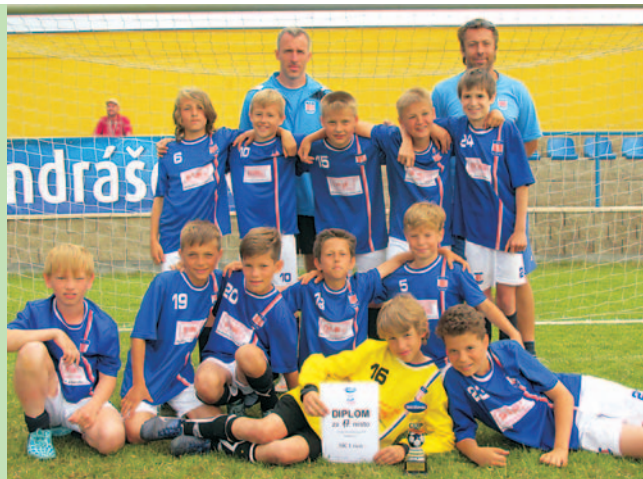
Úspěšný tým U11 na finálovém turnaji v Plzni.