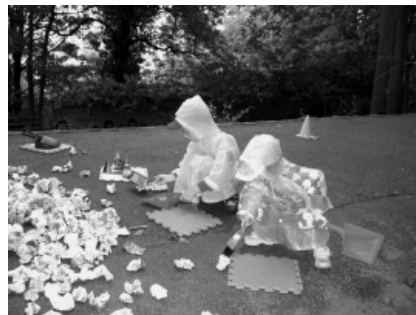
Strašidýlka na Špilberku.

Ohledně bližších informací sledujte plakáty na dveřích „Pastelky“, naše webové stránky nebo se dotazujte mailem či telefonicky.