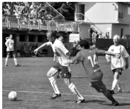
Utkaní SK Líšeň vs. Radnice Líšeň.

Fotbalové utkání proběhlo ve velice přátelské atmosféře za účasti skalních diváků týmu radnice Líšeň. V prvním poločase byla hra velice vyrovnaná, nicméně tým radnice Líšeň dostal gól „do šatny“, a tak byl stav po prvním poločase SK Líšeň – radnice Líšeň 1:0. O poločasové přestávce se na hřišti představily nejmenší fotbalové naděje líšeňského klubu a těsně před druhým poločasem se ve středu hřiště sešli všichni hráči, aby společně zakřičeli vítězný pokřik: „Kdo je nejlepší? LÍŠEŇ!“ Druhý poločas i přes taktické rady trenéra Janiština nezačal pro tým radnice dobře. Hned v úvodu druhého poločasu inkasovali velice rychlé góly. Konečný stav utkání vyzněl lépe pro hráče týmu SK Líšeň 4:1.