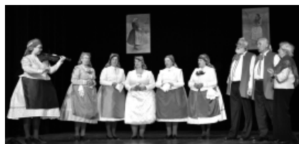
Soubor Stará Líšeň.