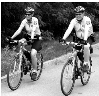
Ilustrativní fotografie: MP v Mariánském údolí.

Na základě požadavků návštěvníků Mariánského údolí, které je druhou největší odpočinkovou lokalitou po Brněnské přehradě, se rozhodlo vedení MČ Brno-Líšeň vyvolat jednání s ředitelem MP Brno z důvodu neukázněných majitelů psů, kteří porušují vyhlášku o volném pohybu psů a dále neukázněnosti některých řidičů, kteří porušují zákaz vjezdu s cílem tuto přestupkovou činnost co nejvíce eliminovat. Výsledkem jednání je nasazení cyklohlídek v lokalitě Mariánského údolí. Každý víkendový den od 10.00 hod. do podvečerních hodin budou dvoučlenné hlídky provádět dohled nad dodržováním veřejného pořádku a ochranu majetku. Pomocí bicyklů mohou strážníci efektivněji provádět hlídkovou činnost v tomto rozlehlém území, ve kterém je zcela nemožné využívat motorizovanou techniku.