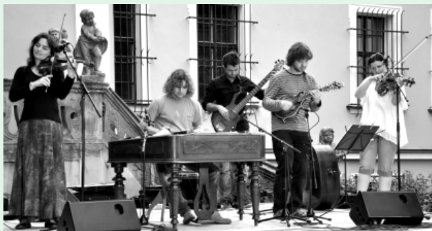
Cimbal Classic.

Je příjemně vlhký páteční podvečer a zámek Belcredi naslouchá pro něj nezvyklým zvukům; dusotu dětských nohou, rozvázným krokům vážených pánů a cupitání dam. A také smíchu, bujarým dialogům i tlumeným hovorům. Náhle veškerý šum utichne a nádvoří zámku rezonuje jen svištěním lehkého vánku. A pak to začne – za své hudební nástroje usedají čtyři muži v oblecích a na malé pódium se svižně vyhoupne statný muž s vizáží loupežníka a chvíli po něm žena – nevěsta.