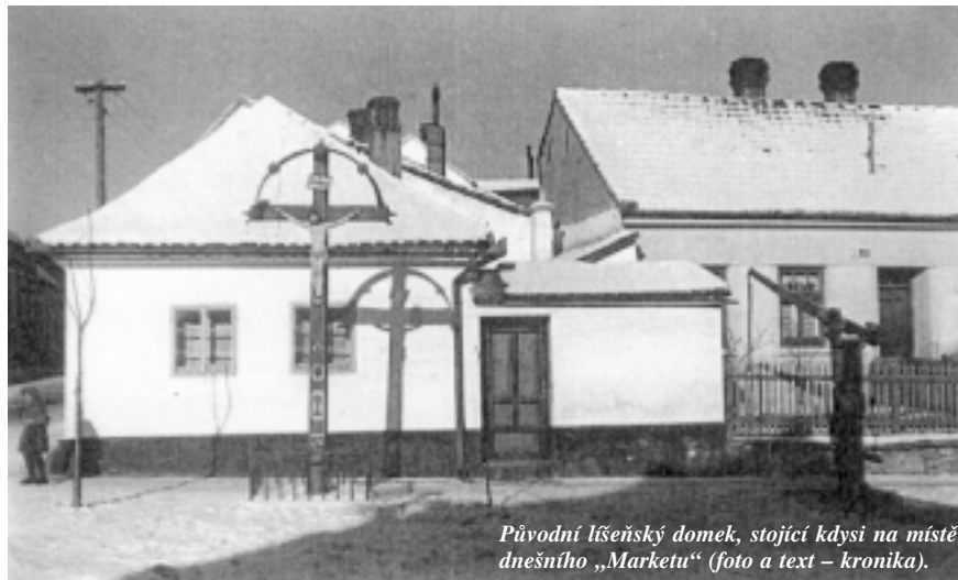
Původní líšeňský domek, stojící kdysi na místě dnešního „Marketu“ (foto a text – kronika).