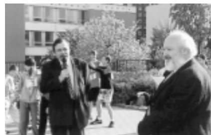
Setkání obou starostů před zahájením závodu.

Od vinohradské radnice potom závodníci a závodnice odstartovali na náročnou trať v délce 5,3 a 10,6 kilometru (dvě kola) směrem k líšeňské radnici. Trasa byla vedena středem líšeňské-