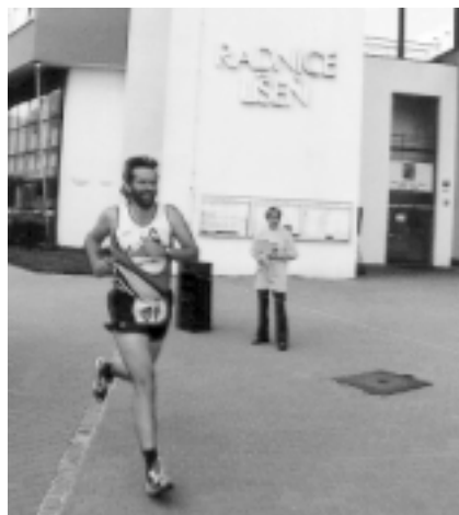
Nejvyšší bod trasy závodu u líšeňské radnice.