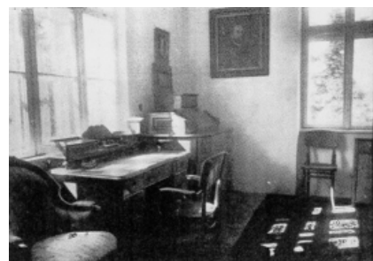
Foto nahoře – pracovna F. Bartoše, dole rodný dům v Mladcově u Zlína, stav z roku 1914.