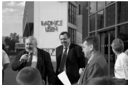
Slavnostní zahájení běhu před líšeňskou radnicí.