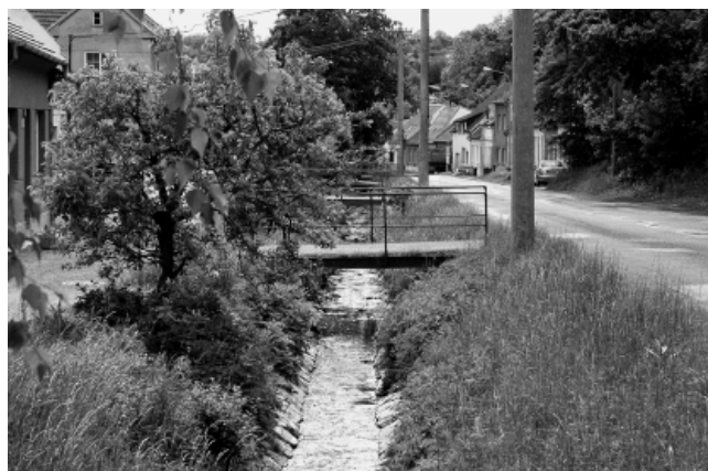
Dolní část toku souběžná s ulicí Ondráčkovou.

Zasedání Zastupitelstva MČ Brno-Líšeň se bude konat 29. 6. 2006 v 17.00 hod. v sále líšeňské radnice.