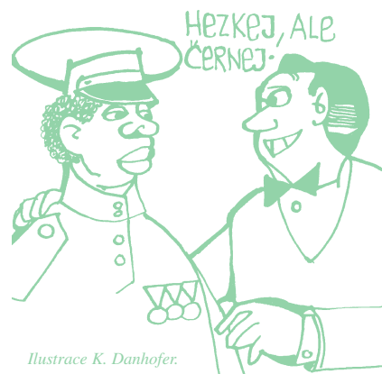
Ilustrace K. Danhofer.

Tajenka z minulého čísla: „...s medvědem na pivo.“