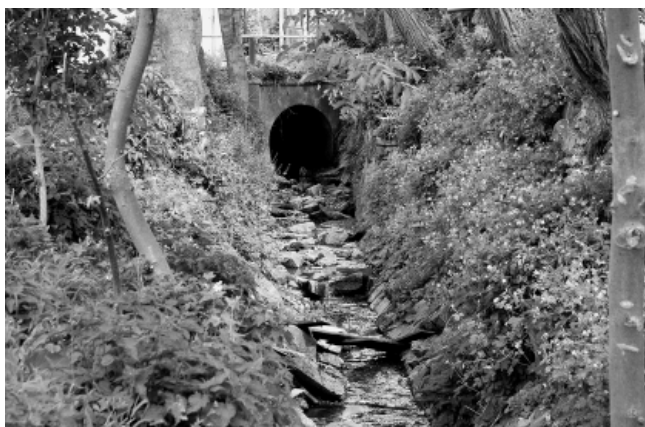
Současný stav koryta Líšeňského potoka u ulice Podhorní.