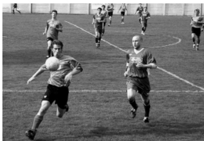
Ilustrační foto ze zápasu se Slavičínem.

Zda se jedná o setrvalou tendenci k lepším zítřkům, ukáží teprve následující zápasy. Pro klidný závěr a setrvání v divizní soutěži a pohodovou přípravu fanů na sledování letošního mistrovství světa v Německu body potřebujeme jako sůl.