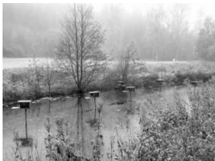
Budky pro kačeny.

Zmíňovat rozsáhlý výčet důvodů, proč právě měsíc červen byl vyhlášen měsícem myslivosti, je pro vnímavou občanskou veřejnost znalé základních zákonitostí života přírody nošením dříví do lesa. Co však dozajista není všem známo, je určitě podstata myslivosti. Co tedy vlastně myslivost je? Učené knihy uvádí: „Je to zvláštní odvětví lidské činnosti, které vzniklo před několika sty lety a prošlo složitým vývojem.“ Prvopočátky společensky vnímané a organizované myslivosti lze zařadit do období po roce 1573, kdy usnesení Českého sněmu poprvé obsahuje nařízení o ochraně zvěře. Tímto ediktem oficiálně vzniká myslivost postavená na zákonných základech. Následně mohlo být započato s řízením lovu přísnými legislativními pravidly, formováním myslivecké etiky a vytvářením mysliveckého aparátu s podrobnými směrnicemi pro činnost. Do této doby se prakticky jednalo pouze o neregulovaný lov bez jakýchkoliv ohledů na zvěř a prostředí. V současné době, v uzákoněné podobě je myslivost považována za hospodářskou a kulturní hodnotu, která je odvětvím zemědělské a lesní činnosti. Je to činnost, jejímž záměrem je chov, ochrana a lov zvěře v souladu s přirozeným biotopem.