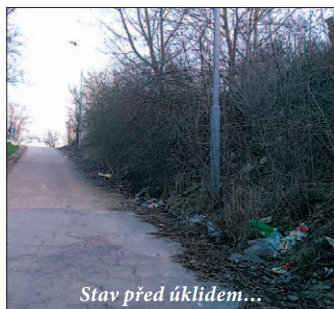
Stav před úklidem...