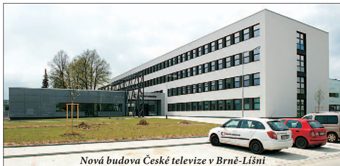
Nová budova České televize v Brně-Lišni