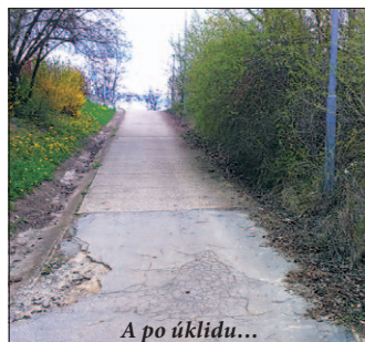
A po úklidu...