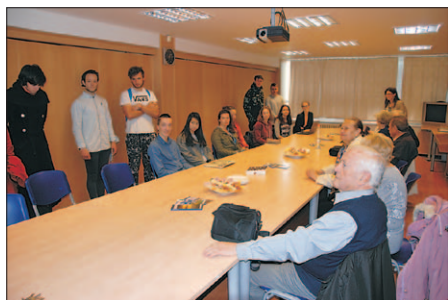
Líšeňští senioři a studenti gymnázia INTEGRA při práci na společném projektu.