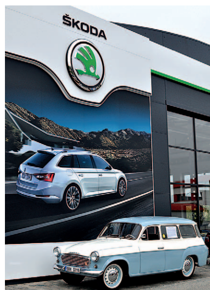
Tak jde čas...

„Rozšířili jsme také prostory pro zákazníky servisu, protože přijímáme až 35 zakázek