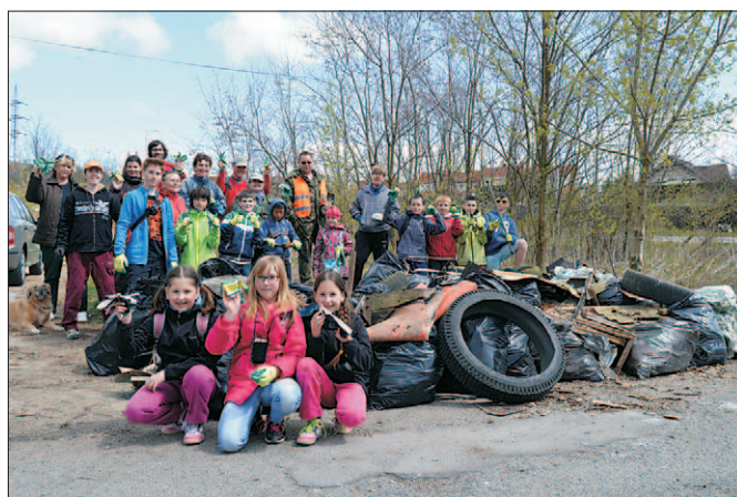
Uklidme Česko na ZŠ Horníkova

Takže sečteno a podtrženo z našeho okolí díky skvělým dobrovolníkům zmizelo téměř 7 tun odpadu! Nad tím, kdo a proč vyveze