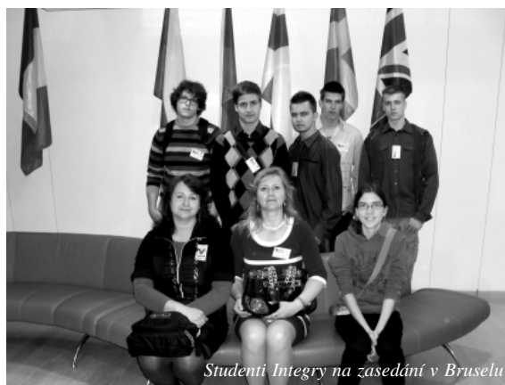
Studenti Integry na zasedání v Bruselu

A co ostatní studenti? I ti se mohou těšit na novinky, které přináší účast INTEGROY v nových národních dotačních programech. Gymnázium INTEGRA BRNO se dále daří úspěšně spolupracovat se státními a krajskými institucemi na poli grantového a dotačního financování svých projektů. Nové projekty INTEGROY získaly velmi vysoké hodnocení od orgánů posuzujících jejich kvalitu. Na jaře tohoto roku jsme se zapojili do projektu EU peníze středním školám, díky kterému vytvoříme mnoho zajímavých digitálních výukových materiálů a modernizujeme