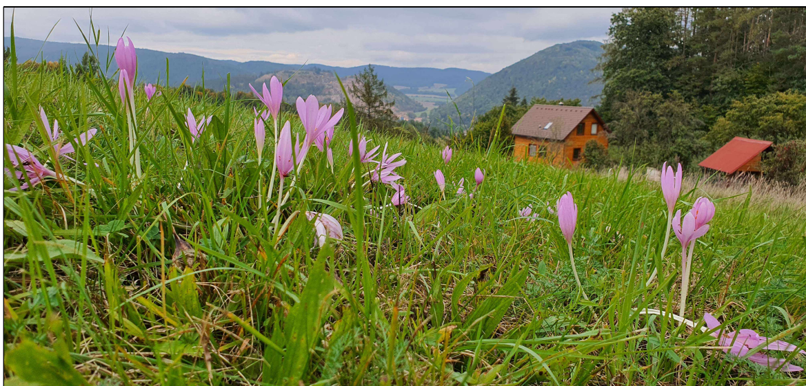
Kvetení ocúnu na luční lokalitě.