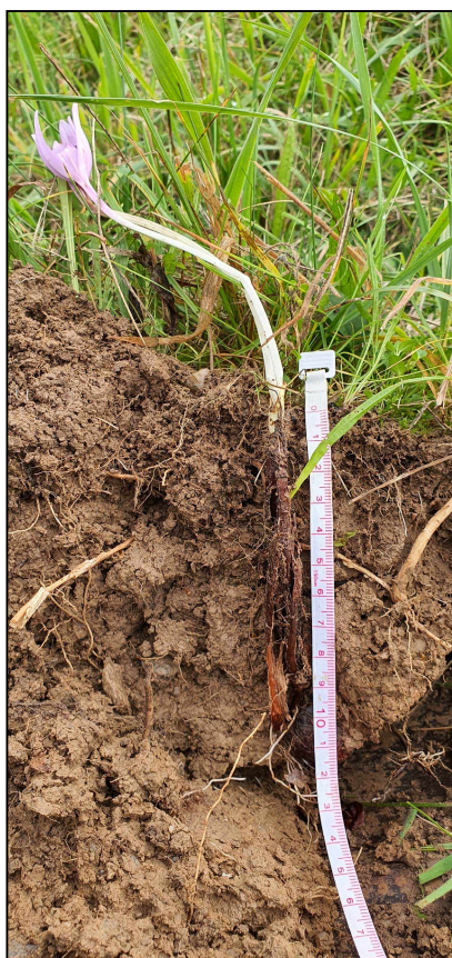
Hlíza v půdním profilu.