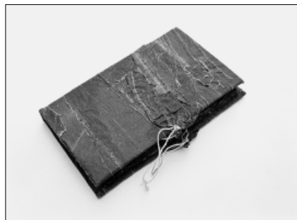
Knížka ze slupek od salámů – projekt „Bezdomovec“ (2000), foto Vít Klusák.