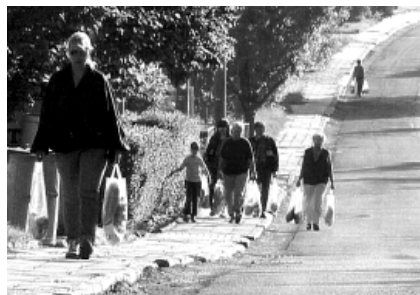
Ranní nákup – projekt „Nic tam není“ (Ponětovice 24. 5. 2003), foto z videa.

Kdybych ale měla říct obecně, jak bych si svou budoucnost představovala, určitě bych chtěla šťastnou rodinu, dělat co mě baví a nemuset se neustále zabývat tím, z čeho mám zaplatit nájem. Takže nic neobvyklého.