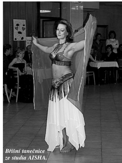
Břišní tanečnice ze studia AISHA.