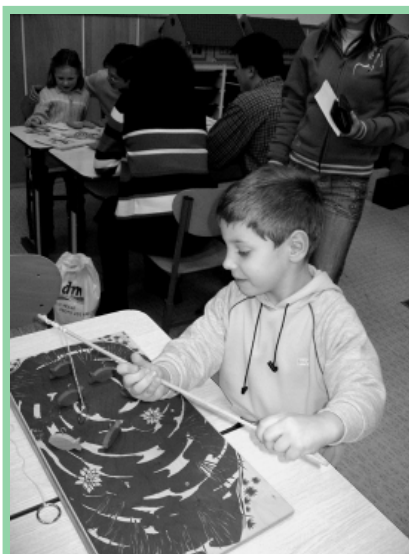
...a rybáři při zápisu na ZŠ Holzova.