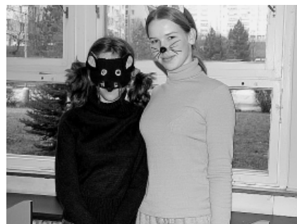
...a Tom a Jerry na ZŠ Masarova.

Myslím, že toto téma děti naprosto pohltilo, protože i moje ratolest zaryté trávající na mé přítomnosti opustila bezpečí mé náruče a vesele odhopsala, aby se s paní učitelkou a ostatními kamarády vypravila na dobrodružnou cestu za skřítkovým dědečkem. Děti nejdříve překonaly lávku přes potok (lavička na cvičení), uzoučkou