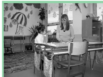
Zápis na ZŠ Novolíšeňská.

Ve dnech 19. 1. 2007 přišli budoucí prvňáčci k zápisu. Čekaly je usměvavé paní učitelky ve čtyřech připravených třídách. Kromě učeben byla připravena i chodba a školní družina, aby si