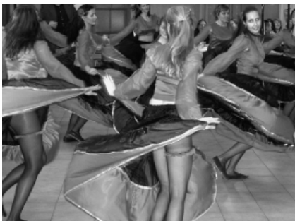
Soubor „Mystery“ – Sokol Líšeň.