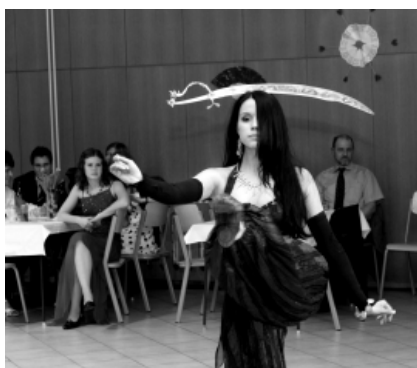
Orientální tanečnice ze studia ZAYNAH