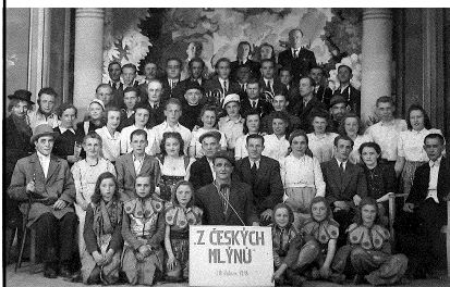
Líšeňský divadelní ansámbl účinkující ve zpěvohře Z českých mlýnů z roku 1946