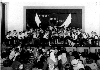
Padesátičlenný dětský smyčkový soubor při vystoupení asi v roce 1952