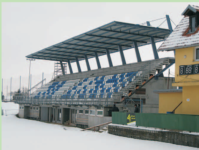
Nová tribuna poskytne divákům stovky zastřešených míst.