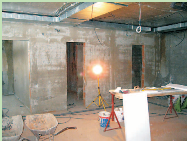
Nově budovaná kabina hráčů.