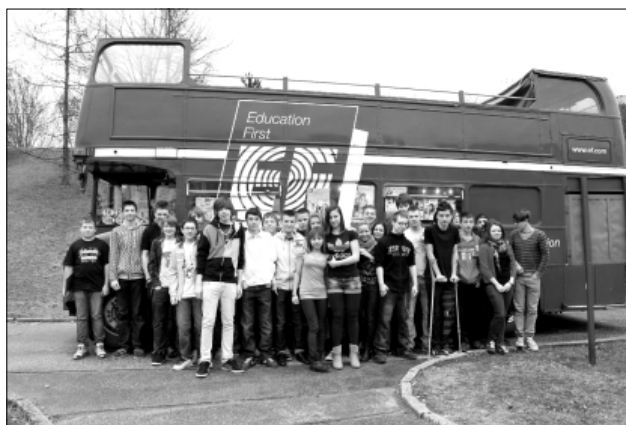
V rámci vzdělávací akce English Week přivezlo Gymnázium INTEGRA BRNO do Lišně i pravý londýnský Double-Decker

Od školního roku 2013/2014 bude výuka na Gymnáziu INTEGRA BRNO, které je fakultní školou Masarykovy univerzity, začínat v 9.00 a i nadále budou zachovány menší studijní ko-