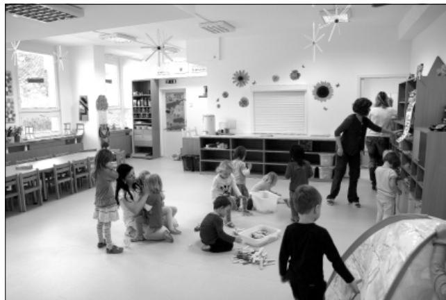
První den provozu Školky Pastelka na Poláčkově ulici.

Školka Pastelka je jednou z aktivit projektu „Práce a rodina v Brně-Lišní“, který pomáhá sladovat pracovní a rodinný život rodin v Brně-Lišní a tím podporovat rovné příležitosti obou rodičů na trhu práce.