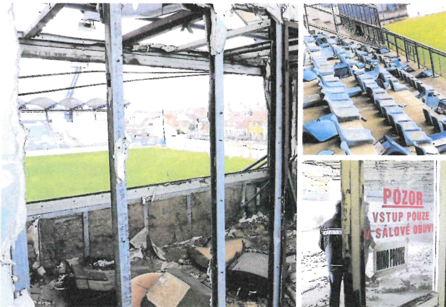
Chátrající stadion Prvoligový fotbal se v Dřnovicích na Vyškovsku hrál naposledy v roce 2005. Aréna, která kdysi plnila také požadavky pro evropské poháry a nastoupila na ní česká reprezentace, už léta chátrá. → Video a více fotografií na bmo.idnes.cz